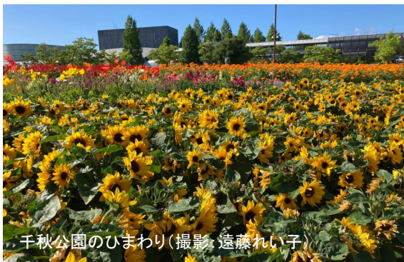
千秋公園のひまわり

えっ！財源を言わない岸田首相。物価高騰には無策。消費税は増額の思惑。賃金上がらず、年金下がる