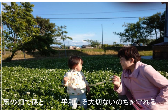
裏の畑で孫と 平和にそ大切ないのちを守れる

ロシアのウクライナ侵略を口実に、防衛費の2倍化を公言する政権与党「財源は示さず」岸田首相はバイデン大統領に「防衛費の相当の増額」を約束したが、国会では何